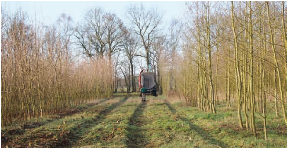
Abb. 8: Variante „Mitanbau“ – Erstmalige streifenweise Ernte von Energieholz

Streifenmischung gut realisiert werden. Darüber hinaus lassen sich nach den bisherigen Erfahrungen konkurrenzbedingt negative Wirkungen für Wachstum und/oder Qualität der benachbarten Bestockungskomponenten mit einer zielgerichteten Festlegung der Rotationsdauer des Kurzumtriebs weitgehend vermeiden. In den ersten Kulturjahren konnte sogar durch das Vorwachsen der Baumarten des Kurzumtriebs ein für die Baumarten des Hauptbestandes offensichtlich förderliches Mikroklima entstehen.