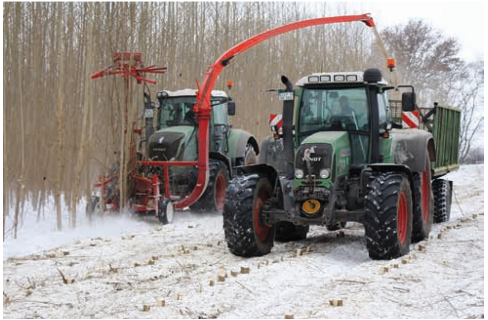
Abb. 7: Variante „Vorwald“ – Erstmalige ganzflächige Ernte von Energieholz

Die Variante „Mitanbau“ ist sowohl waldbaulich als auch organisatorisch anspruchsvoll. Sie trägt mit dem anfänglichen Nebeneinander von Nutz- und Energieholzproduktion Merkmale der Mittelwaldwirtschaft in sich. Aspekte der Nutzung sowie waldbauliche Anforderungen zwingen jedoch zu einer räumlichen Trennung der gleichzeitig begründeten Baumarten von Hauptbestand (Nutzholzproduktion) und Nebenbestand (Energieholzproduktion) (Abb. 8). Dieses kann mit der beschriebenen