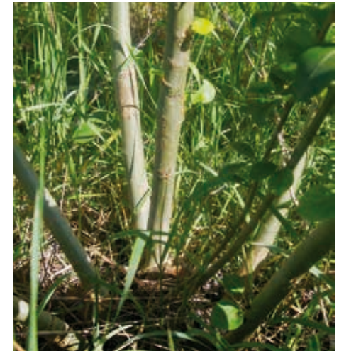
Abb. 3: Pappel-Stockausschlag nach erstmaliger Ernte