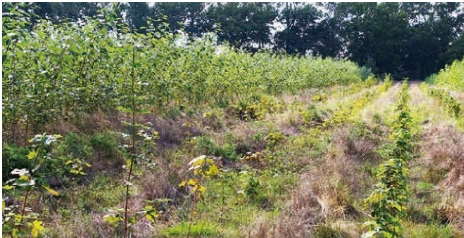
Abb. 4: Variante „Mitanbau“ mit Spitzahorn zur langfristigen Nutzholzproduktion und Pappel zur Energieholzproduktion im Kurzumtrieb

Standorte: Im Forstamt Schildfeld (Westmecklenburg) wurden an zwei Orten mit sehr unterschiedlichen Standortverhältnissen Erstaufforstungen in Form der Variante „Mitanbau“ begrün-