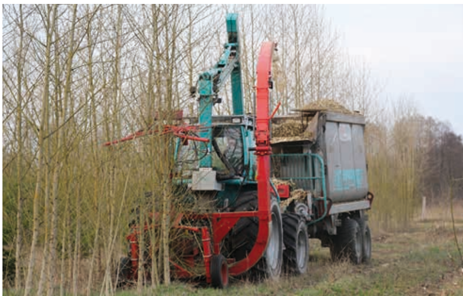
Abb. 5: Anbau-Mähacker bei der ersten Pappelernte nach 7 Standjahren