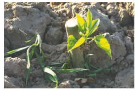
Abb. 2: Pappel-Steckholz beim Austrieb

Bei der Variante „Mitanbau“ sollen auf der Aufforstungsfläche gleichzeitig schnellwachsende Baumarten für den Kurzumtrieb sowie Baumarten des angestrebten Hochwaldes begründet werden (Abb. 1, rechts). Das zeitliche Nacheinander der zuvor beschriebenen Vorwaldvariante wird hier durch ein räumliches Nebeneinander er-