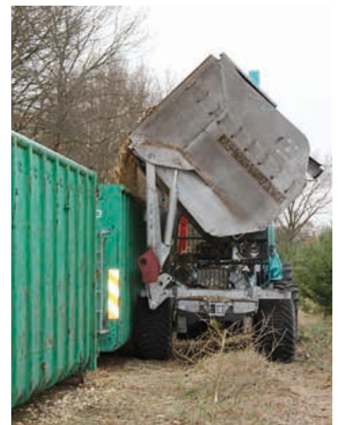
Abb. 6: Überladen des Hackgutes in Transportcontainer am Bestandesrand